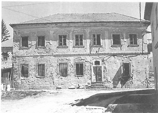
Dům New York před opravami

Mnoho lidí, kteří procházejí bývalou Zuckerovou uličkou v Lázních Kynžvartu kolem starého domu, jej považují za ruinu a bezcenný, ovšem ti neznají jeho historii.