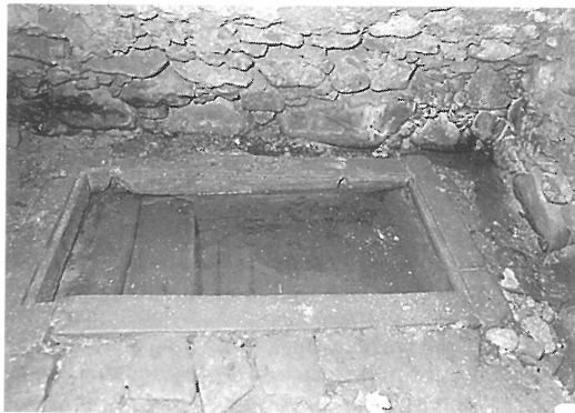
Rituální lázeň, mikve (NPÚ)

V roce 1770 došlo k rozsáhlé přestavbě domu ve stylu synagogy, protože se v této době nepovolovaly stavby velikých domů židovských majitelů, a po čase přestavěna na dům na zboží. V roce 1771 vypukl mezi Barochem a Dietlem před místní právem spor. Prvním sporným bodem bylo okno do dvora mýtnice. Okno podle Dietla bylo ošklivé, nápadné a odrazovalo přicházející