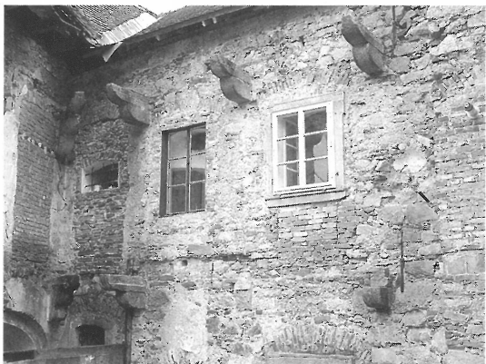
Krakorce ve dvorním traktu jsou zřejmě dovezené z hradu Kynžvart (NPÚ)