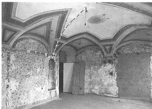
Velký sál s původní malbou na stropech (NPÚ)

obsah vody je nejméně 762 litrů. Je obdélníkového tvaru a přístup do vody je po dřevěných schodech. Dříve "mikwi" používali kněží, kteří se rituálně znečistili. Dnes